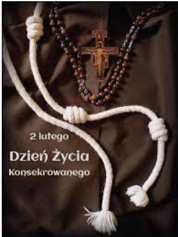
2 lutego Dzień Życia Konsekrowanego